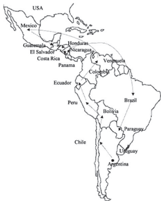
Путь ТироМобилья по Южной Америке (см. файл с русскими названиями стран)

ния, представителей Панамериканской Организации Здравоохранения (ПАОЗ) и UNICEF. В заключении в каждой из стран представителям ПАОЗ, ВОЗ и UNICEF презентовались предварительные результаты проведенных исследований.